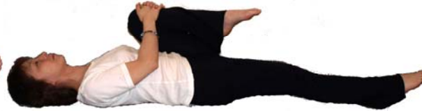
⑩息をはきながら膝を胸にひきよせる 呼吸を続けながら10秒キープ 息をはきながら足をおろす