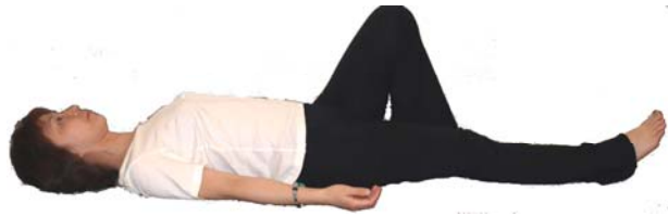
⑨右足を立てひざにする