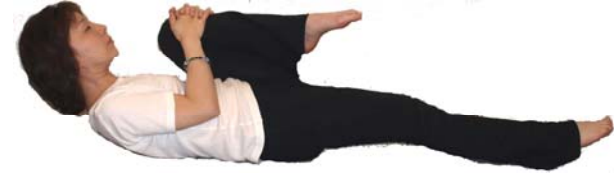
⑪はく息とともに膝を顎（余裕があれば額） に近づける 呼吸を続けながら10秒キープ 息をはきながら足をおろす 左足も同様に⑨～⑪