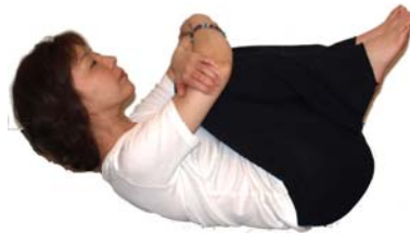
⑬息をはきながら膝を両手で抱え 顎を膝に近づける。 呼吸を続けながら10秒キープ 息をはきながらゆっくり足を 床におろす