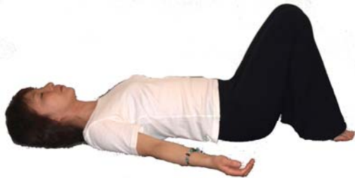
⑫両足を立てひざにする